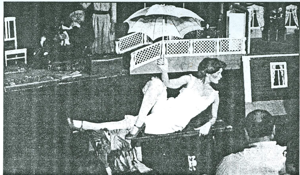
■ Riia Uus Teater mängis Tšehhovi "Kajakat".