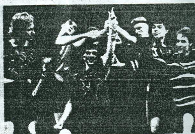
Noortekamp on valmis võitlemiseks.

"West Side Story't" mängitakse Linnahallis 15. ja 16. oktoobril kell 18.00 ja 17. oktoobril kell 17.00. Piletihinnad on 15 - 50 krooni.