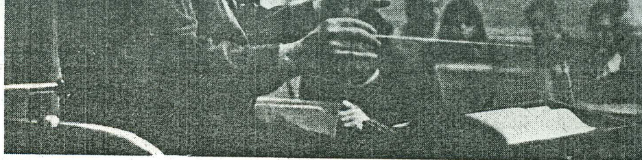
Eri Klas, nüüdsest on ta aumärgi "Suomen Leijonan Ritarikunnan Komentajamerkki" omanik.