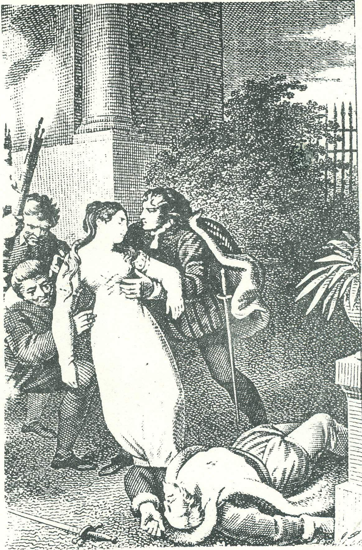
DON JUANI MÄNG