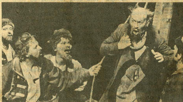
Stseenid ooperist. Traagilised ja mõtlemapanevad.

Teatriimet aitavad luua paljud, keda publiku poolelt kunagi laval näha ei saa. Ometi on näiteks just jumestaja osavad käed ja kunstniku silmad need, mis näitlejale õige rolliväljumise annavad.