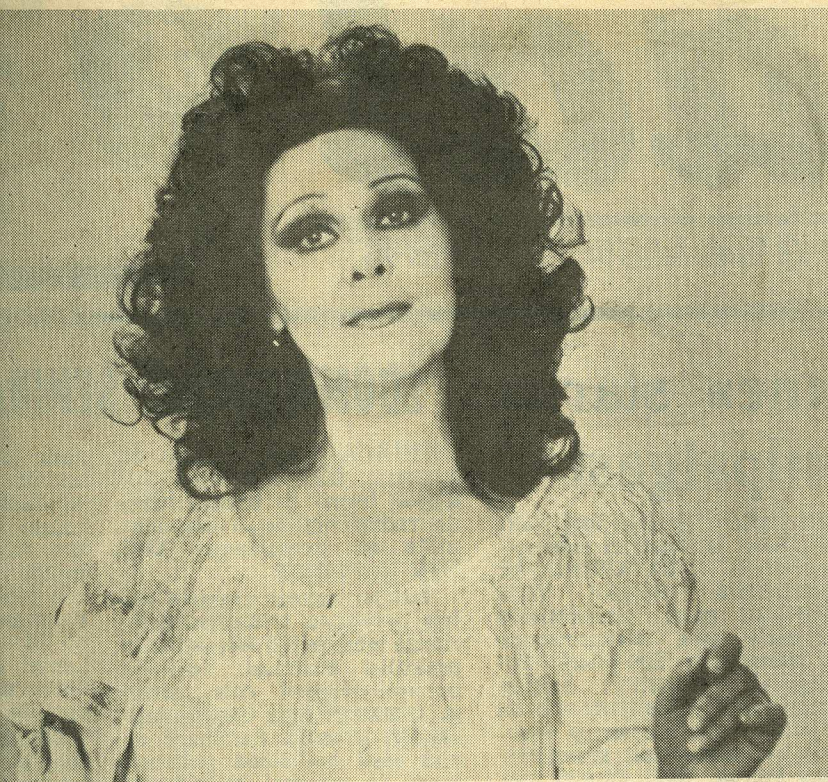
es — Lucia di Lammermoor.

Alcina» esi- T «Estonia» (eel)hooaja. le taas üle partii NSV MARGARI-