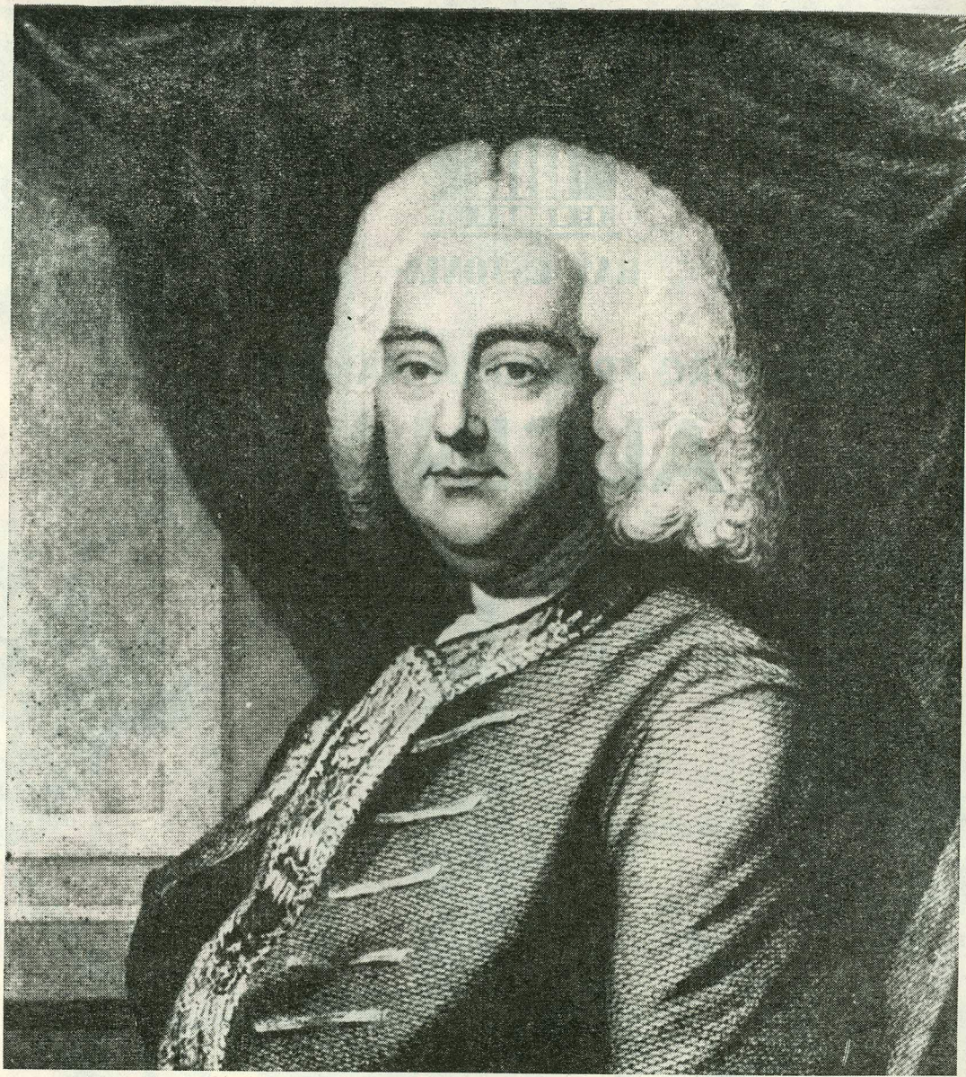
Georg Friedrich Händel (1685—1759) Thomas Hudsoni maali järgi