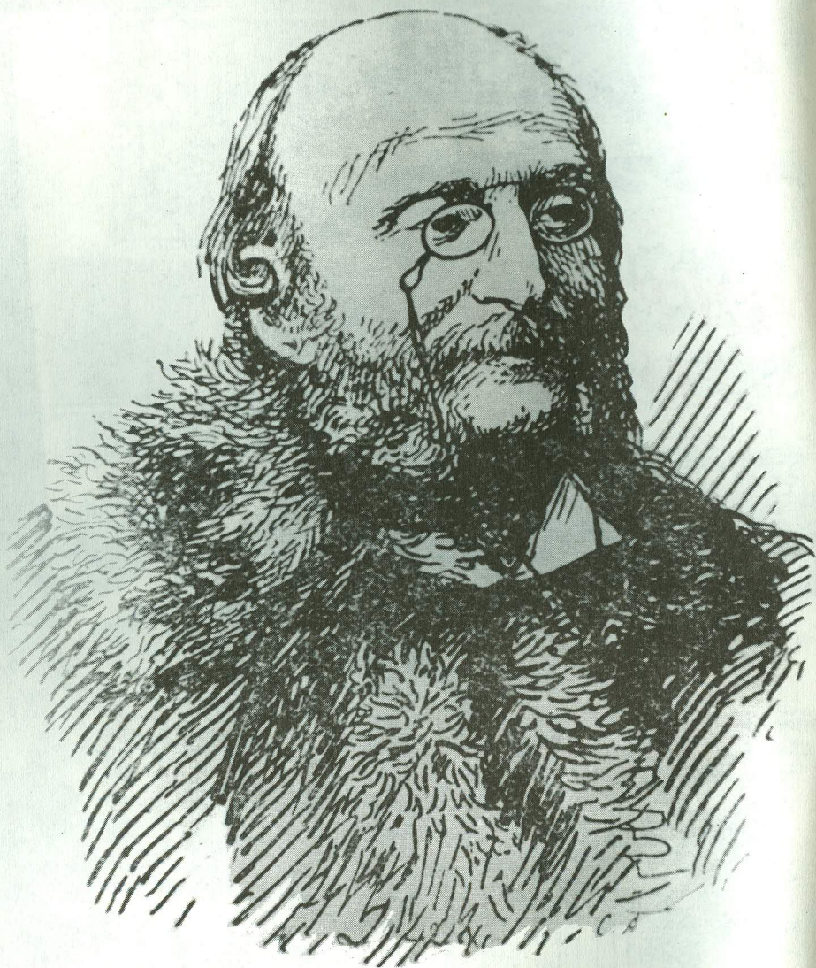
Jacques Offenbach (1819—1880)