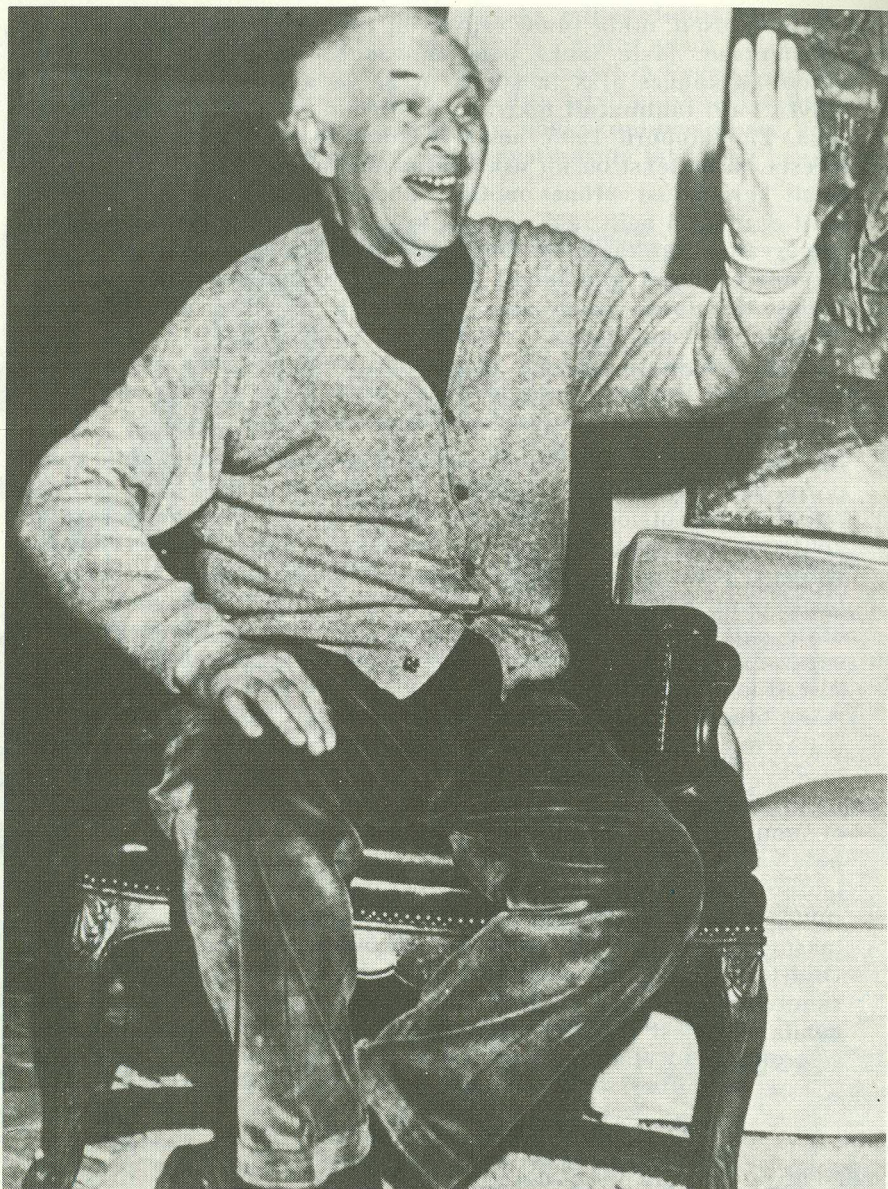
Marc Chagall (1887—1985)

MARC CHAGALL (1887—1985) — juudi rahvusest prantsuse kunstnik sündis Vitebski lähedal Valgevenemaal. Alustas kunstiopinguid Peterburis, 1910. aastal siirdus Pariisi, kus sai mõjutusi uutest kunstivooludest (sh. kubismist, orfismist jt.). 1914. aastal naases Venemaale, kus elas ja tegutses kuni 1922. aastani, siis läks uuesti Prantsusmaale. 1941—1947 elas USA-s. Marc Chagall on väga produktiivse kunstnikuna viljelnud nii maali, graafikat, keraamikat, monumentaalmaali (Pariisi Grand Opéra ja New Yorgi Metropolitan Opera laemaalid), lavakujundust (Stravinski «Tulilind», Gogoli «Revident», on teinud koostööd Meyerholdi teatriga, Juudi teatriga Moskvast) kui ka illustratsiooni (Gogoli «Surnud hinged», Piibel) jm. Loomingus põimuvad noorusmälestused külaelust juudi mütoloogiaga. Ta ei arvesta ruumi ega aega ja põimib erksavärvilised põhimotiivid (kell, viiul ja viiuldaja, kana, kits, majad ja katused) fantaasiaküllasteks lüürilisteks, aga väga terviklikeks teosteks.