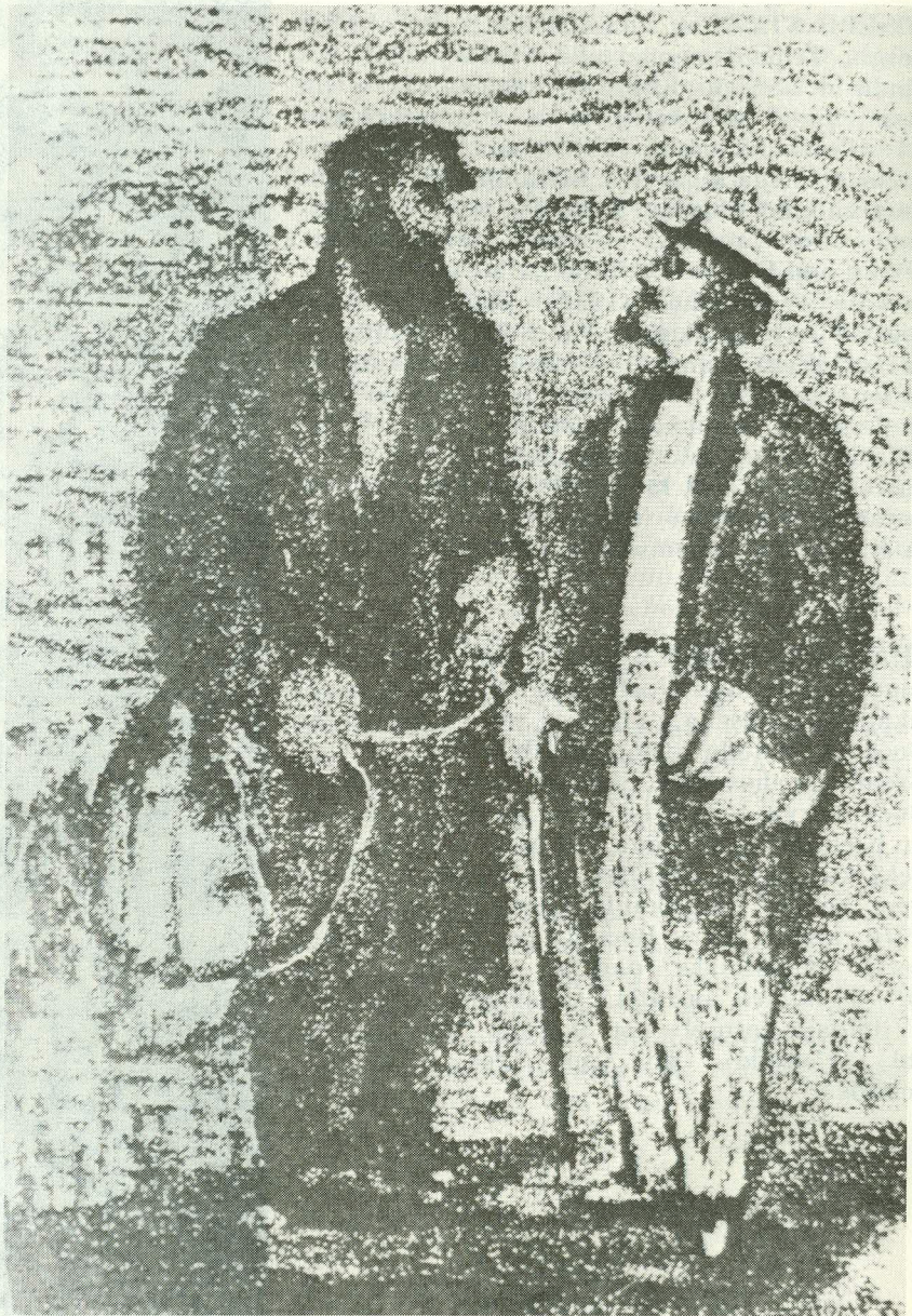
Šolem Alejchem ja Tevje. A. Kaplani joonistus