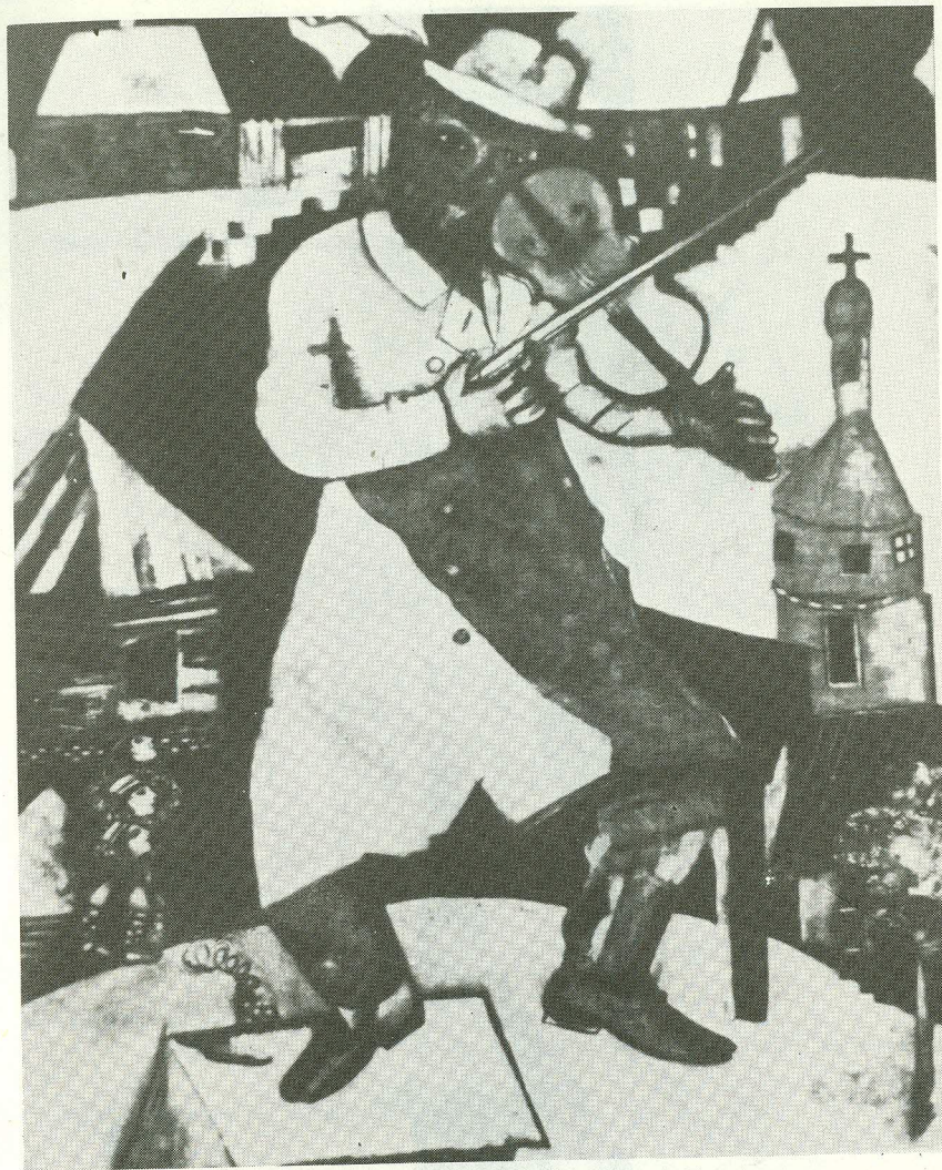
Marc Chagall. «Viiuldaja». 1912—1913. Stedelijk Museum, Amsterdam