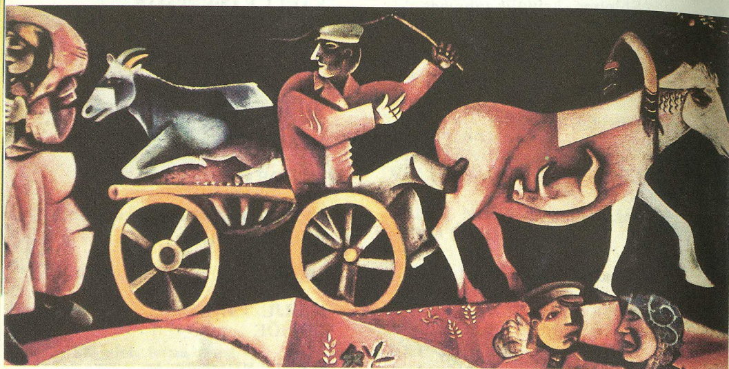
Marc Chagall. «Veisekaupmees». 1912. Basel, Kunstimuuseum