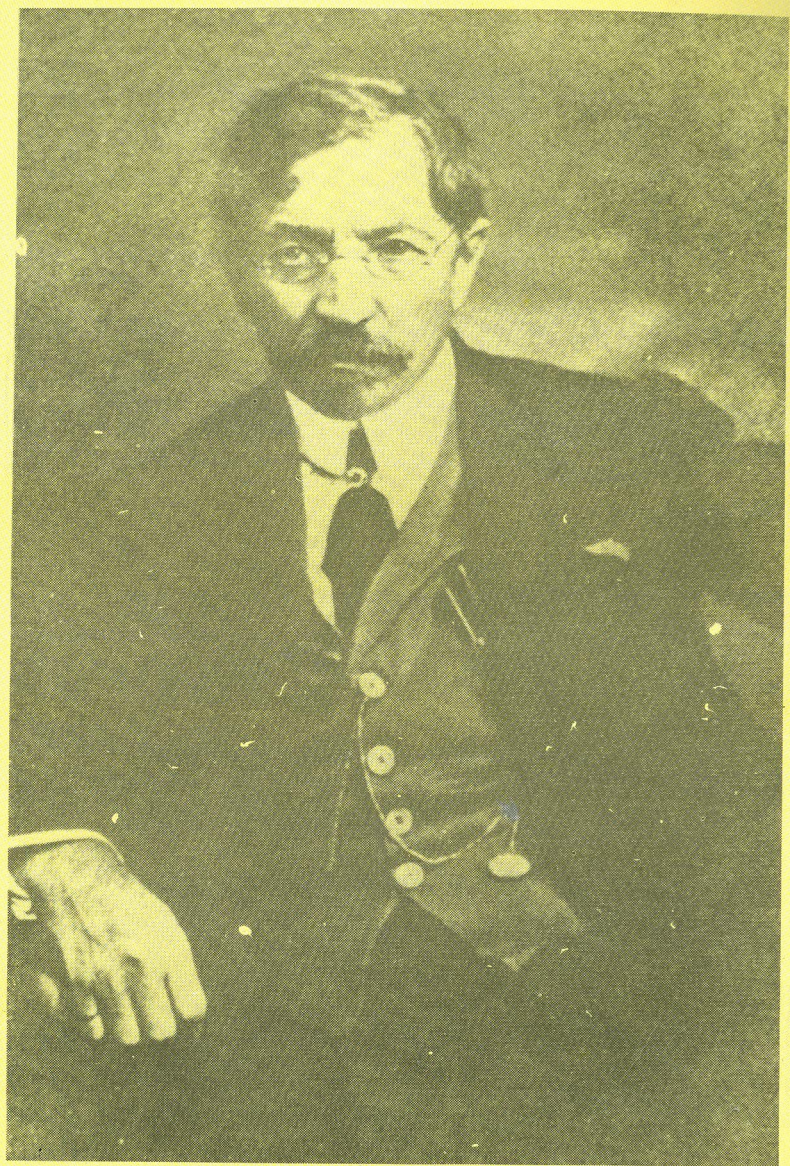
Šolem Alejchem (1859—1916)