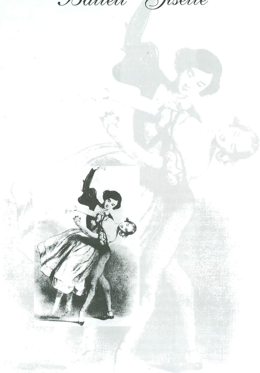
Loucién Petipa ja Charlotta Grisi – Krahv ja Giselle'i osade esmaesitajad

– õieti "Giselle ehk Vilid" (Giselle ou les Wilis) – esietendus 18. juunil 1841. aastal Kuningliku Muusikaakadeemia Teatris Pariisis (Théâtre de l'Académie Royale de Musique Paris), praeguses Grand-Opera's. Kuigi oli käes juba suvepuhkuste aeg, tõi esietendus enneolematu triumfi. Juba aasta pärast jõudis see lavale Inglismaal ja Austrias, veel aasta hiljem Itaalias ja Saksamaal, 1846. aastal ka USA-s jne. Peterburis jõudis ballett lavale 1842. aastal, kus nimiosa tantsis Jelena Andrejanova, hiljem Fanny Elssler, Charlotta Grisi jt. 1884. aastal lõi oma versiooni Marius Petipa, uuendades 1887. aastal.