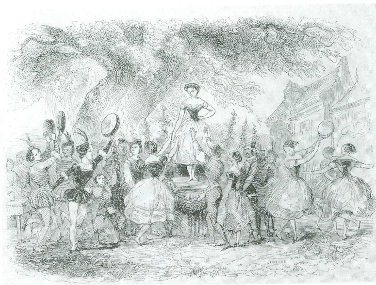
19. sajandi gravüür "Giselle'ist"