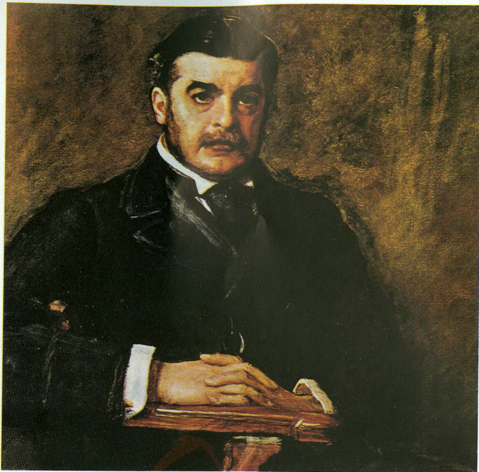
Sir Arthur Seymour Sullivan (1842—1900)

John Everett Millais'i portree (Õli, 1888, Londoni Rahvusgalerii)