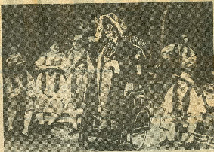
● Dulcamara — Märt Laur.