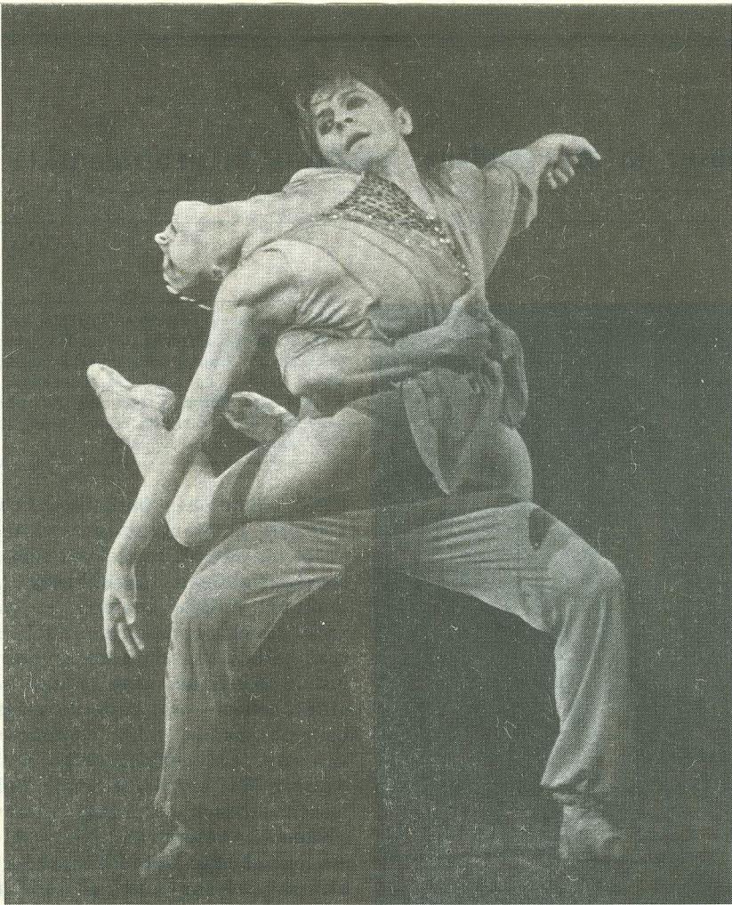
Stseene balletist «Meister ja Margarita».

naalne, psühholoogiliselt aga väheveenev, ei jõua kummagi nimiosalise siseelulise portreoni. Hoogne, «dansantne» seejuures kindlasti.