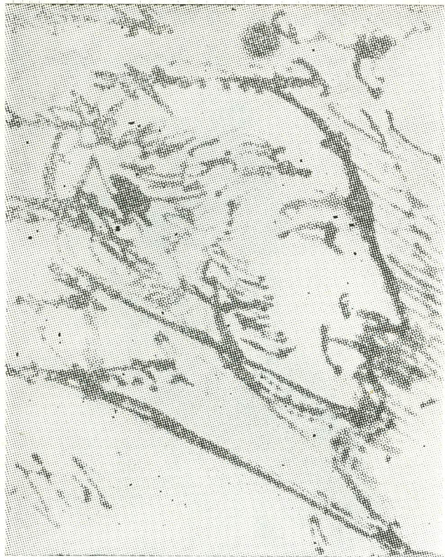
НИКОЛАЙ МИХАЙЛОВИЧ КАРАМЗИН Набросок А. С. Пушкина (1766—1826)

* Н. М. Карамзин. Писатель, литературный критик, историк. Его «История государства Российского» послужила источником сведений при создании А. С. Пушкиным «Бориса Годунова».