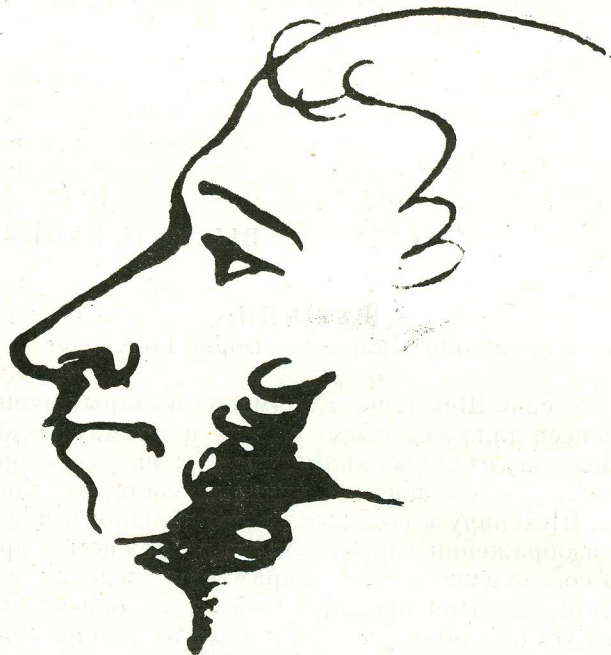
АЛЕКСАНДР СЕРГЕЕВИЧ ПУШКИН (1799—1839) Автопортрет

«Как теперь хорош «Борис». Просто великолепен. Я уверен, что он будет иметь успех, если будет поставлен.»