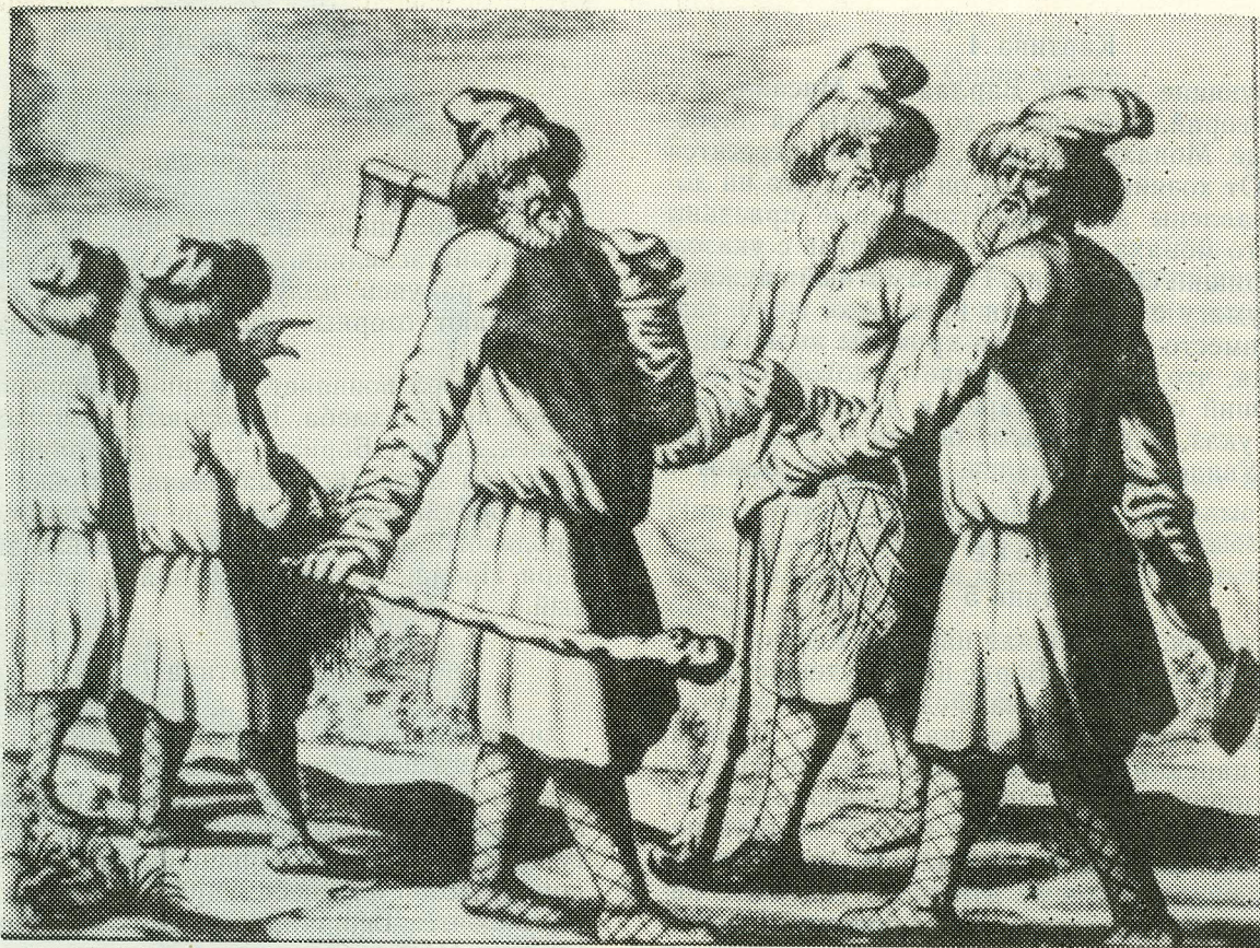
Русские крестьяне XVII века. Гравюра из книги А. Олеариуса.