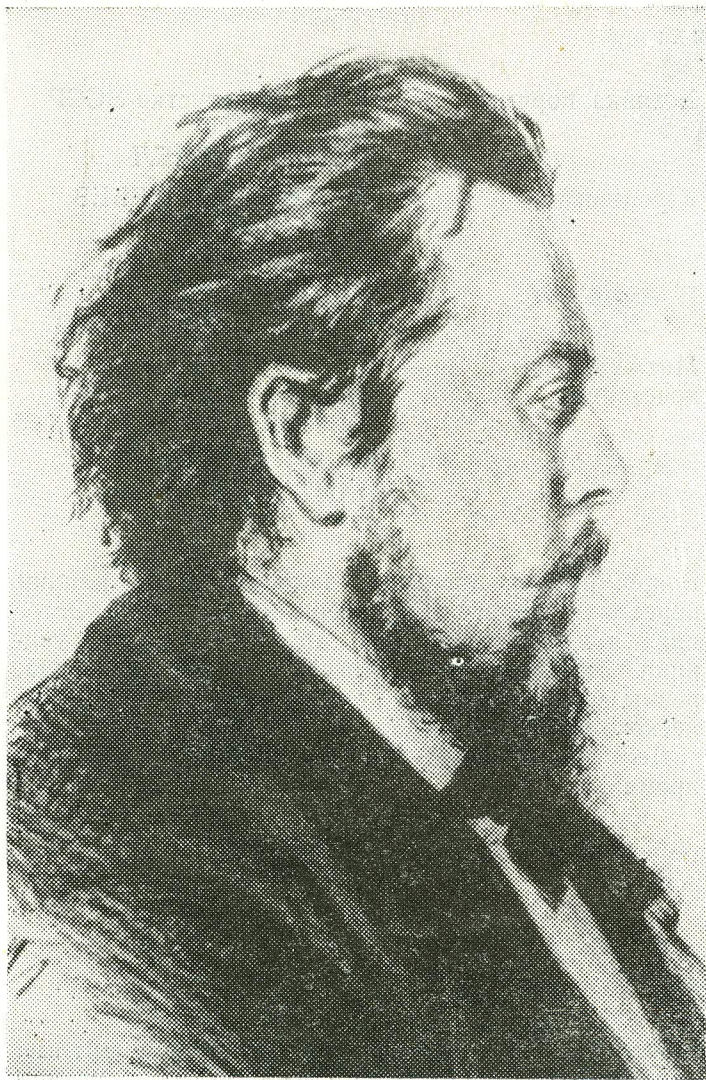
МОДЕСТ ПЕТРОВИЧ МУСОРГСКИЙ (1839—1881)