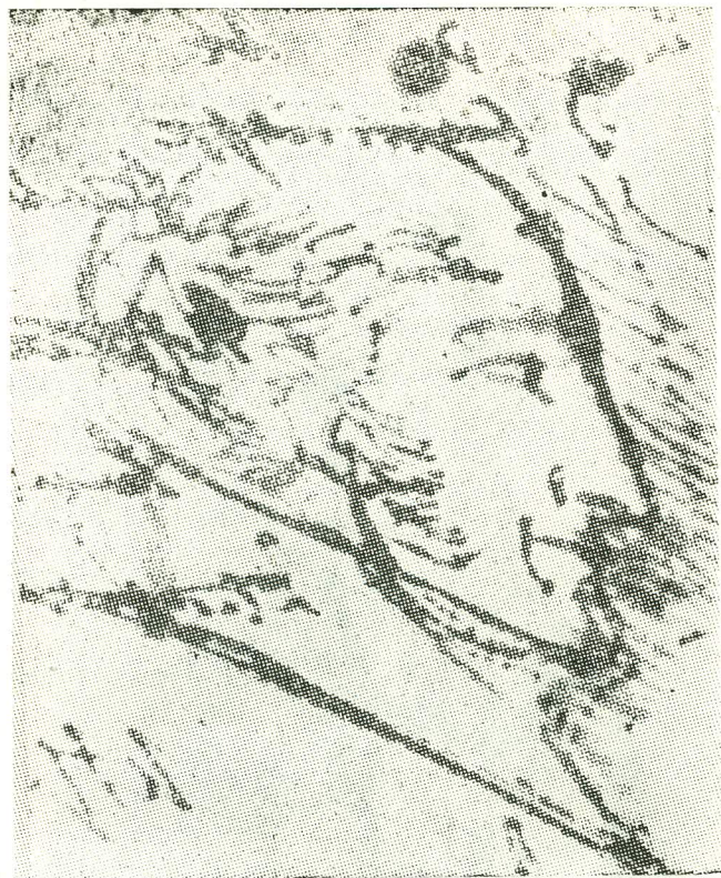
NIKOLAI KARAMZIN (1766—1826), vene kirjanik, kirjanduskriitik ja ajaloolane. Karamzini «Vene riigi ajalugu» oli Puškinile olulisimaks lähtematerjaliks «Boriss Godunovi» kirjutamisel. A. Puškini visand