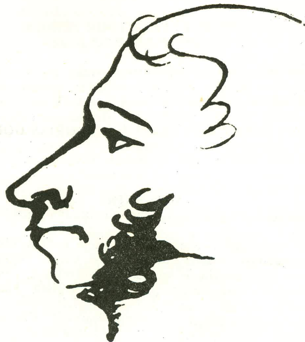
ALEKSANDR PUŠKIN (1799—1837), autoportree

«Küll on «Boriss» nüüd tore. Lihtsalt suurepärane. Olen veendunud, et lavastamise korral saab sellele olema edu.»