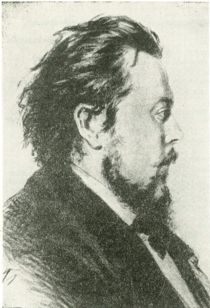
MODEST MUSSORFSKI (1839—1881)