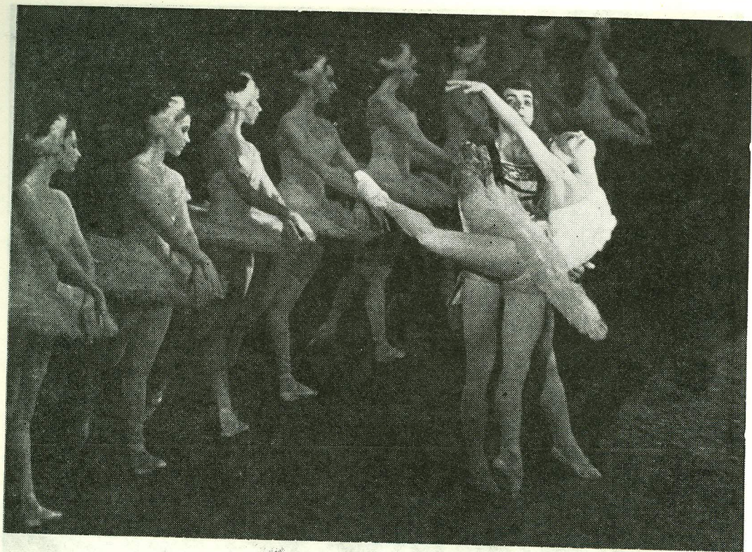
Stseen «Luukede järvest».