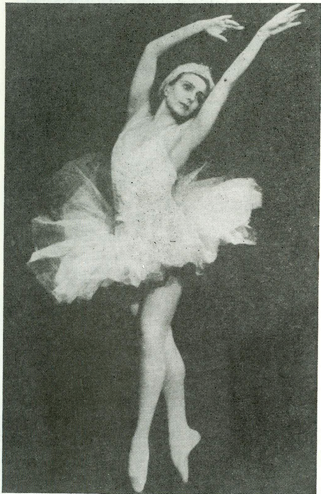
NATALIA DUDINSKAJA (s. 8. VIII 1912 Harkovis)

on lõpetanud Leningradi koreograafiakooli 1931. a. A. Vaganova õpilasena. Juba oma esimestel tööaastatel Kirovi-nim. teatris tantsis ta klassikalise repertuaari tipposi — Odette-Ottiliet, Aurorat, Giselle'i jt. — ning paistis silma oma ereda temperamendi ja laitmatu tehnikaga. N. Dudinskaja suuremate saavutuste hulka kuuluvad veel Gajane, Tuhkatriinu, Raimonda jt.