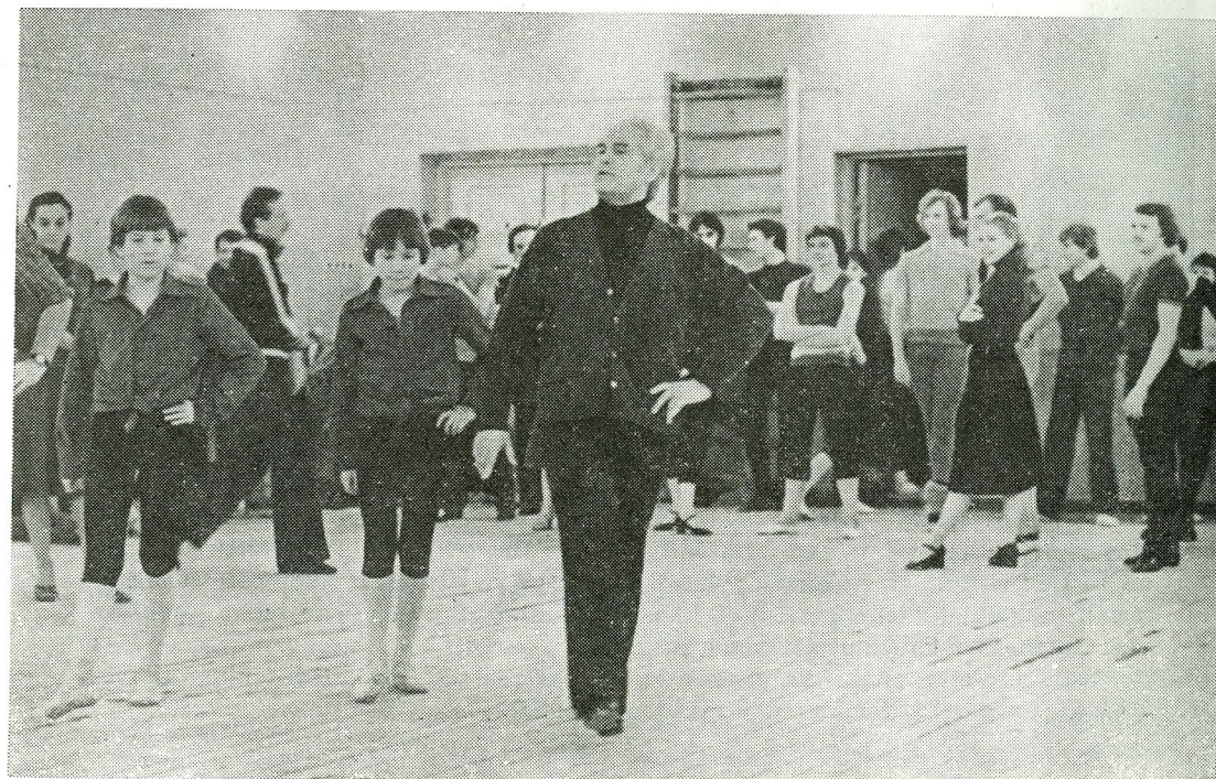
K. Sergejev «Estonia» teatri proovisaalis