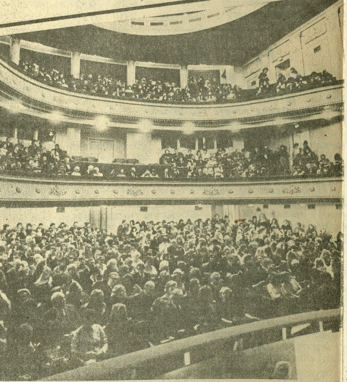
Сейчас погаснет свет и поднимется занавес...