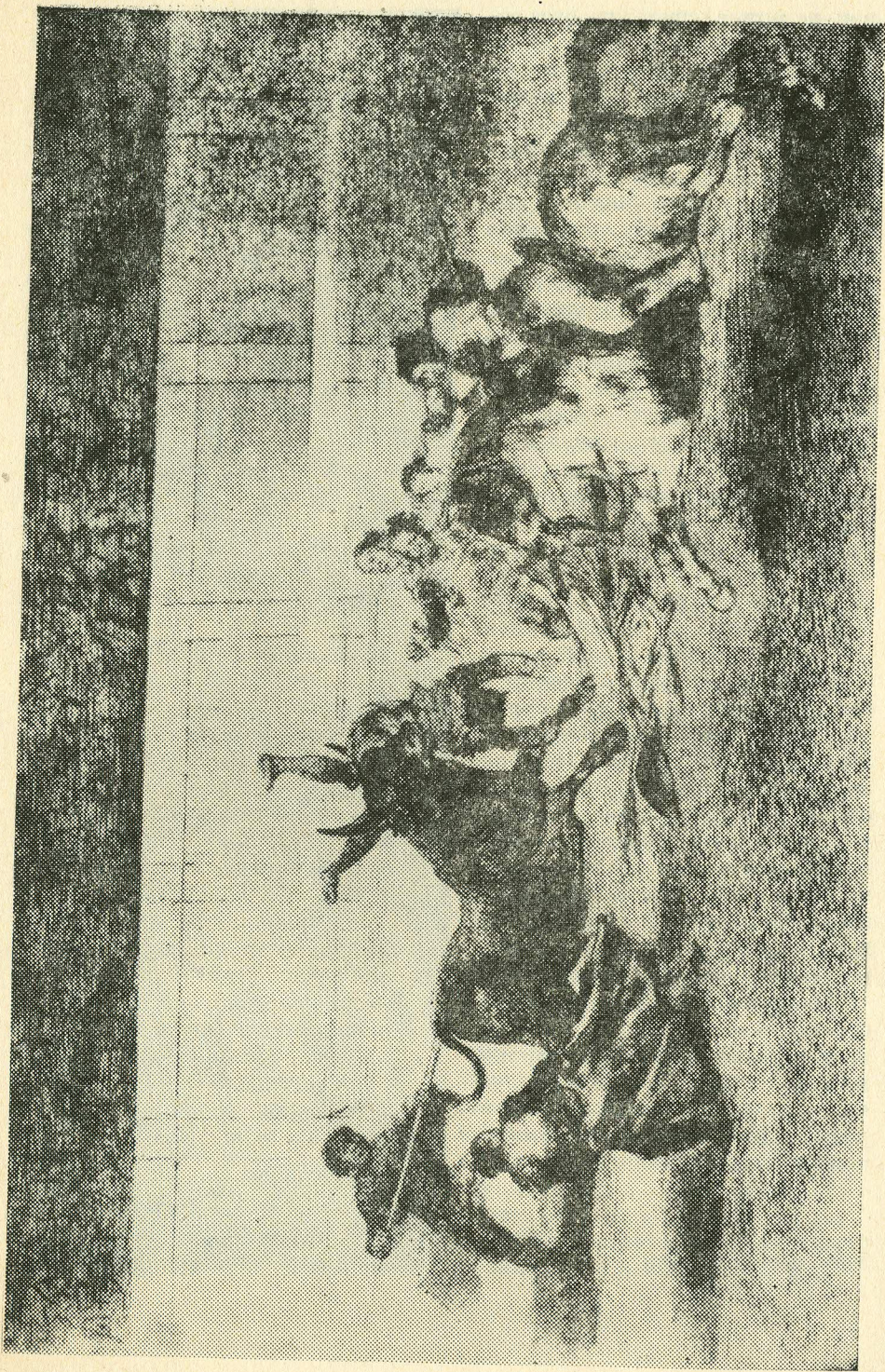
Из серии Ф. Гойа «Бой быков». 1815