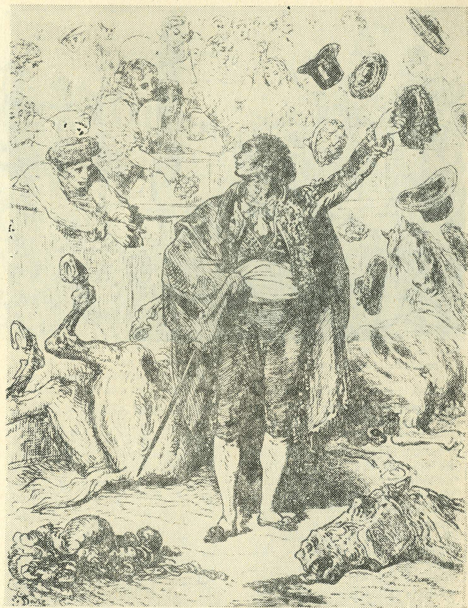
Г. Дорэ — «Триумф эспады». 1878