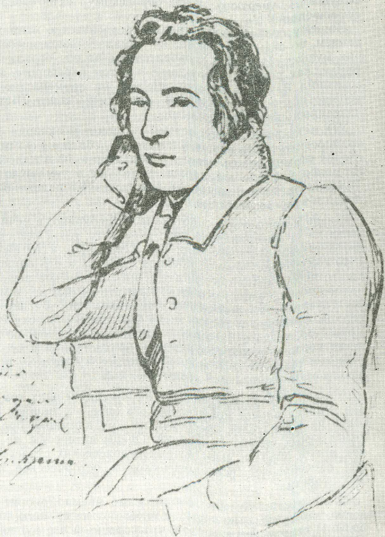
ГЕНРИХ ГЕЙНЕ (1797—1856)

Рисунок Манделя 1829 года. В этот год Вагнер познакомился с Гейне, чьи произведения послужили импульсом к написанию «Летучего Голландца» и «Тангейзера»