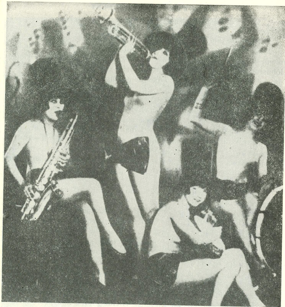
Naisorkester 20-ndate aastate Saksa kabareele tüüpilises «riietuses»

kompositsioonis ja ka tekstis. Tekkisid uued heliloojad, kes komponeerisid eriti kabareele laulukesi, nagu Ralph Benatzky (hiljem operettide komponist) ja palju teisi.