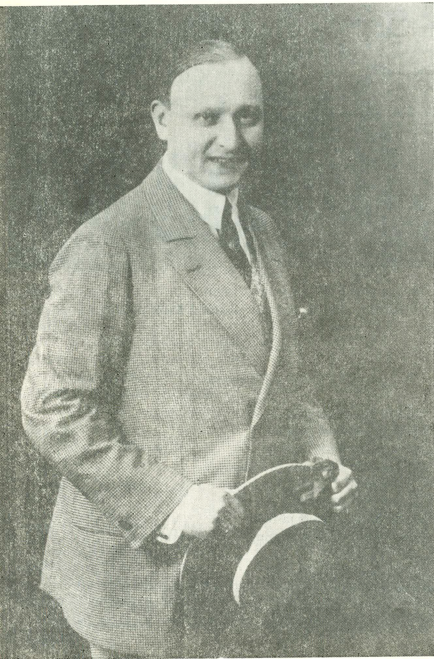
Paul Pinna kabaree-meeleolus (1915)