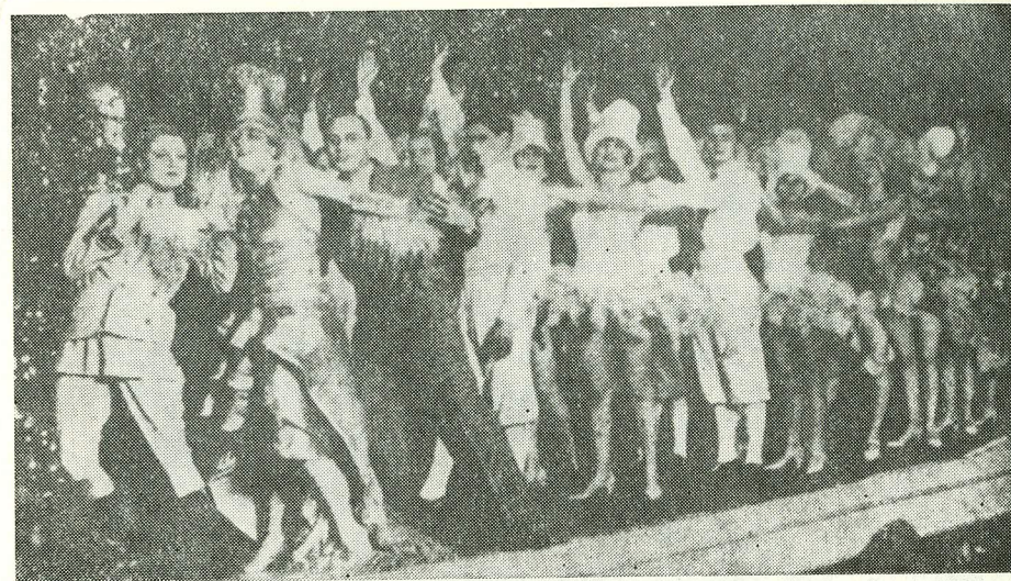
Stseen programmist «Paraguay» (1926). Autor — Rudolph Nelson, nimekas helilooja, pianist ja organisaator I Maailmasõja järgses Saksa kabarees