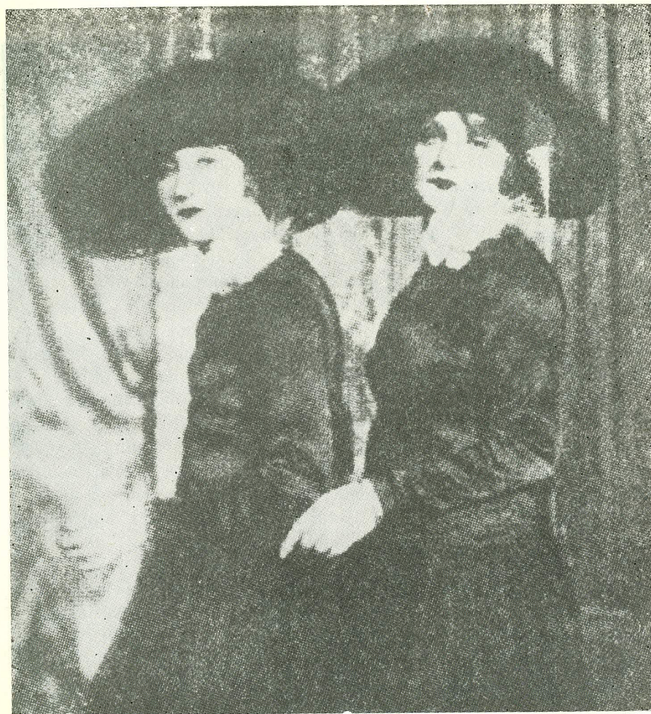
Margo Lion ja Marlene Dietrich esinemas revüüs «Miski on õhus» (1928)

Tegelikult on kõik see, mis kabaree lõbus-tõsisesse, naljakasse või satiirilisse agressiivsusesse puutub, olemas sestpeale, kui inimene kunstis tegelikkust kujutada suudab. Kabaree on muutunud vormides ja moes, olemuselt aga jäänud samaks. Vähegi suutlik kabaree on ikka avameelne, terav, häbematu ja ajakajaline.