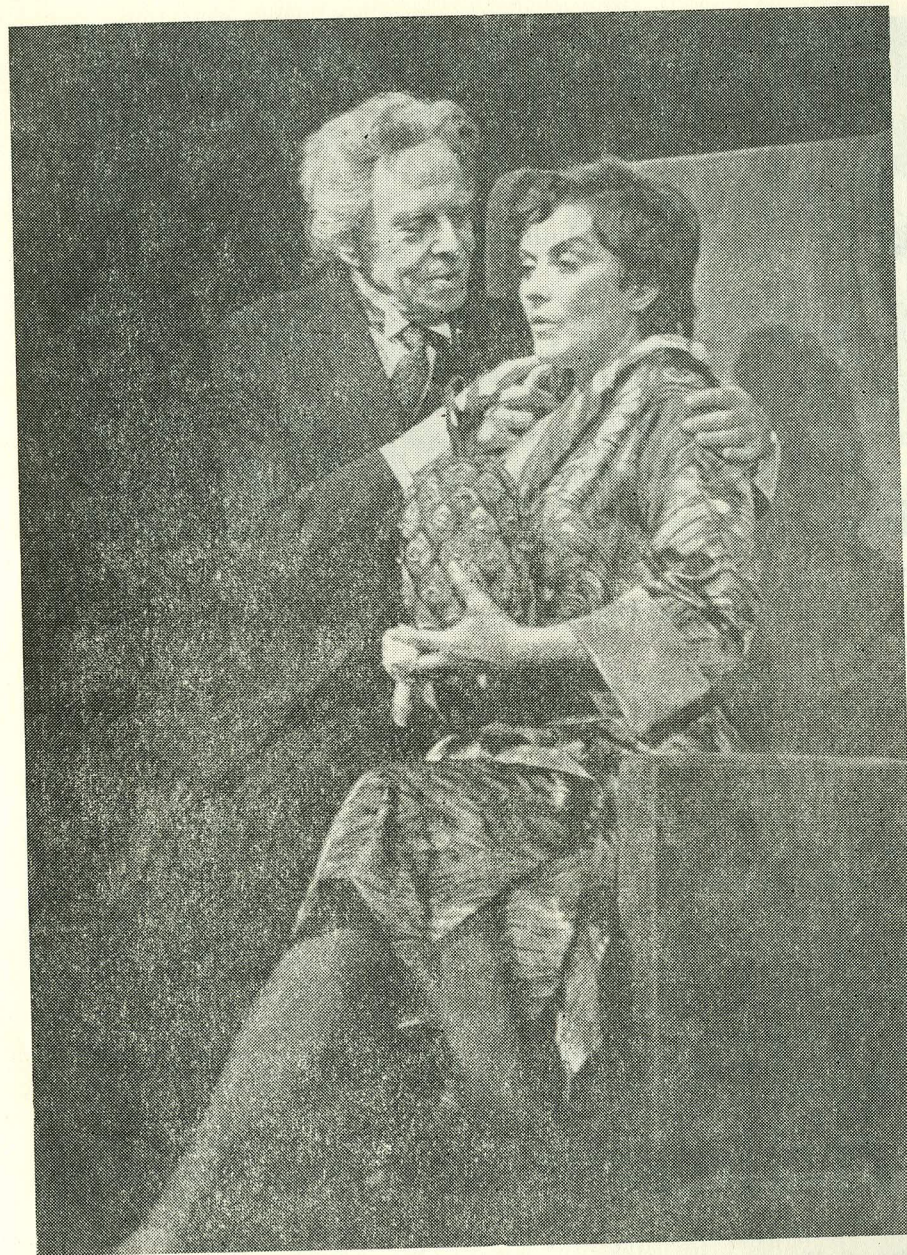
«Kabaree» «Estonia» teatris (1984)

«Kabaree» keskkonna üks poolus on ebatavaline ja peibutav aja-viitemaailm, kus on kombeks vahel tõsiseidki mõtteid serveerida, ehkki pikantses kastmes. Mõjuvad ju revüü ja kabaree sarnaselt helivõimendusega, mis sest, et esimestel on kasutada vaid moraalsed detsibellid.