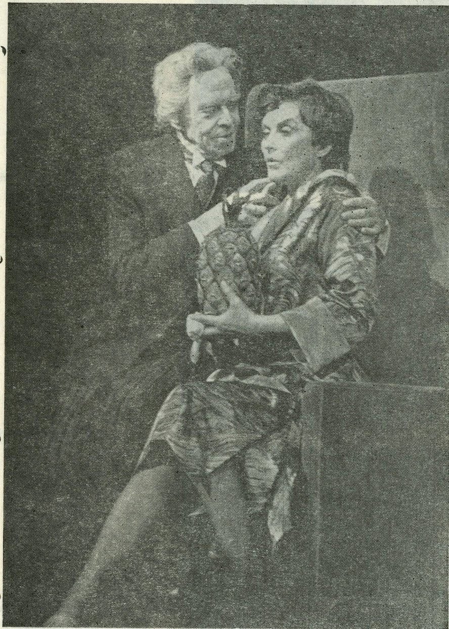
«Kabaree» «Estonia» teatris (1984)

«Kabaree» keskkonna üks poolus on ebatavaline ja peibutav aja-viitemaailm, kus on kombeks vahel tõsiseidki mõtteid serveerida, ehkki pikantses kastmes. Mõjuvad ju revüü ja kabaree sarnaselt helivõimendusega, mis sest, et esimestel on kasutada vaid moraalsed detsibellid.