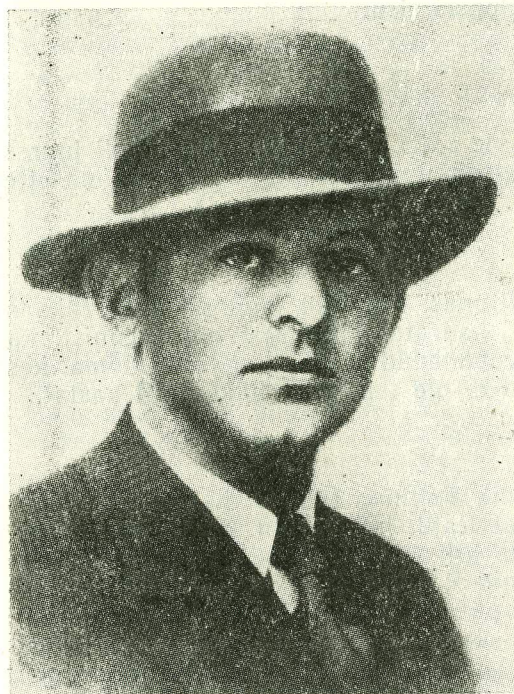
Juhan Sütiste Юхан Сютисте

Ooperi peategelase Ra- ju prototüüp, luuletaja JUHAN SÜTISTE (1899—1945) debüteeris juba gümnaasiumipäevil 1921. aastal.