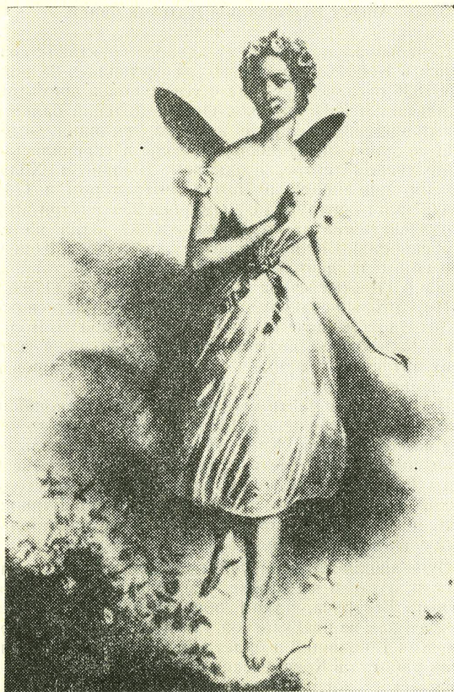
Мария Тальони — Сильфида

По статье В. Красовской «Как и почему родилась «Сильфида». Журнал «Советский балет» № 5 1982 г.