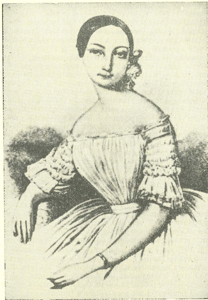
Люсиль Гран — первая Сильфида в постановке Бурнонвиля

Судьба наследия Августа Бурнонвиля сложилась довольно удачно, благодаря бережному сохранению лучших работ хореографа на сцене Датского королевского балета, в том числе и балета «Сильфида», являющегося прекрасным путеводителем к пониманию сущности движения, коренным образом изменившегося балет середины XIX века.