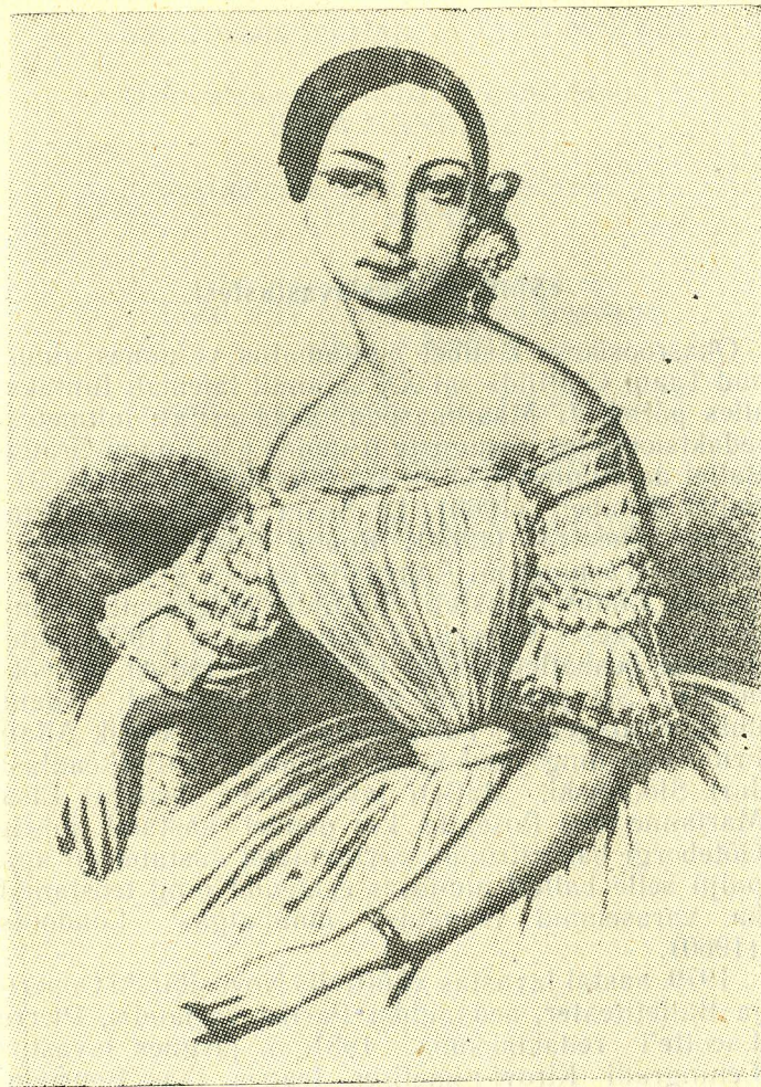
Lucille Grahn, Bournonville'i lavastuse esimene Sülfiid

Bournonville'i «Sülfiid» on nüüdisajal parimaks teejuhiks nendele, kes on huvitatud, millises stiilis ja laadis toimus XIX sajandi keskel koreograafia uuenemine.