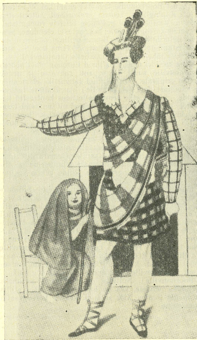
August Bournonville Jamesi osas

August Bournonville oli oma isa ja V. Galeotti õpilane. Hiljem täiendas end kuulsa virtuoosi Auguste Vestrise juures Pariisis, saades seega mõlema tookordse juhtiva balletimaa, Itaalia ja Prantsuse, parima kooli.