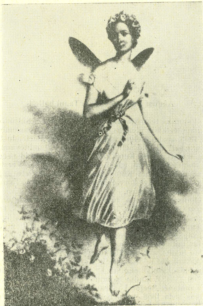
Maria Taglioni Sülfiiidina