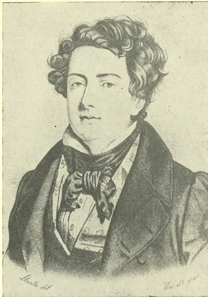
Adolphe Nourrit. Eduard Viiralti teostus (ofort, akvatinta). Pariis, 1927