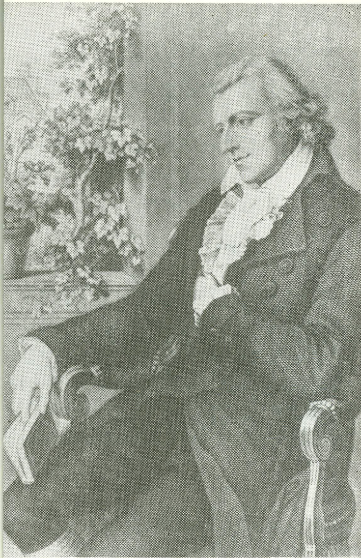
Фридрих Шиллер (1759—1805)

Граф Вальтер намерен сосватать сыну недавно овдовевшую дальнюю родственницу герцогиню Федерику. Сыну о своем решении граф сообщает лишь перед самым прибытием предполагаемой невесты. Федерика и Рудольф выросли вместе, и молодая герцогиня по-прежнему