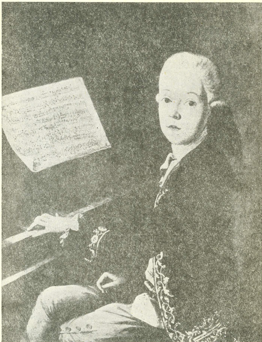
W. A. Mozart aastail 1766/68

Kuueaastaselt komponeeris Mozart oma esimesed instrumentaalteosed, üheteistkümmeselt alustas lavamuusika kirjutamist. 1768. a. valmis laulumäng «Bastien ja Bastienne», esimene tänaseni mängitav Mozarti lavateos, ühevõrd naiivse lapse ja varaküpse geeniuse looming.