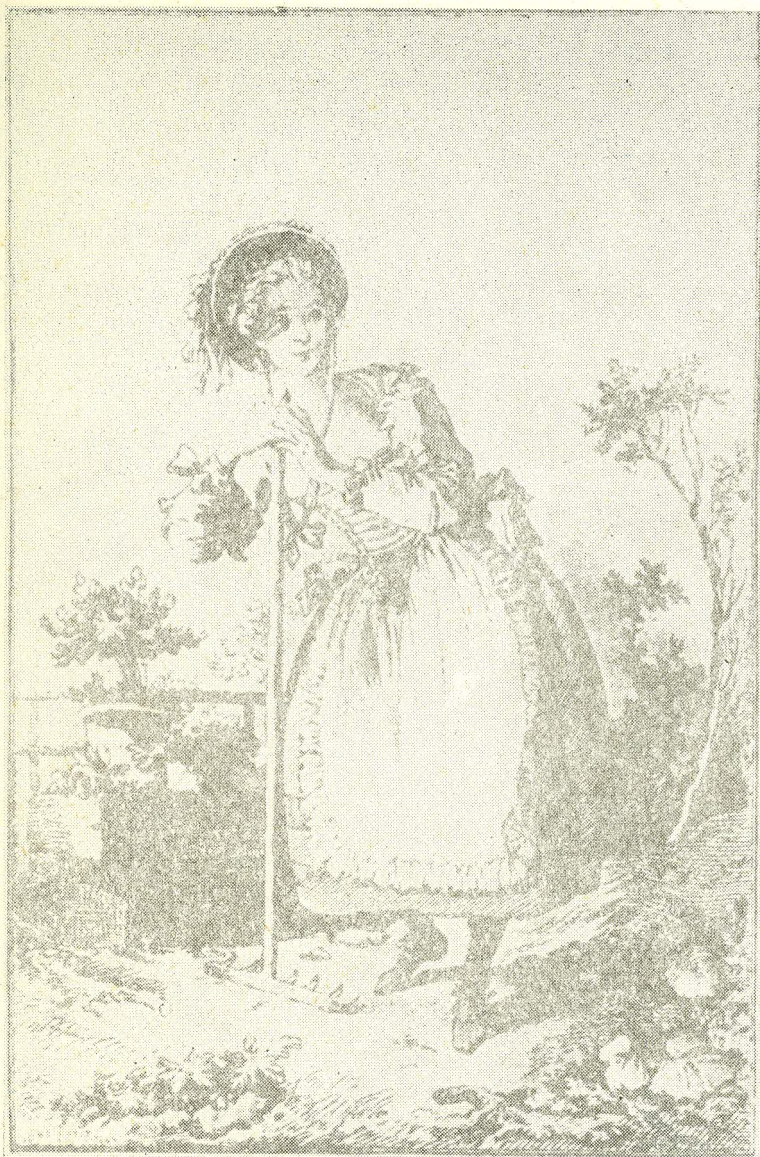
Lamburistseene XVIII sajandist

Teatrit tundis ja tunnetas Mozart väga noorena. Ta lapsepõlveaastate kodulinnas Salzburgis tegutsesid peapiiskopi õueteater, suurte traditsioonidega ülikooliteater, mitmesugused rändteatrid, lihavõttepühade aegu toimusid rahvalikud kannatustemängud. Piiskopliku õuemuusiku Leopold Mozarti lapsed nägid seda üpris mitmelaadset teatritegemist maast madalast. Wolfgang Amadeus oli viieaastane, kui ta juba koorilauljana ühel ülikooliteatri etendusel ise kaasa tegi. Seitsmendast kümnenenda eluaastani reisis imelaps Mozart koos oma vanema õe ja isaga läbi mitmed Saksamaa lääneosa linnad, esines Pariisis, Londonis, Madalmaades, Sveitsis. Suurte linnade kunst mõjutas juba siis tema teadvust. Poisipõlves näidanud ta end osava karakterikujundajana muusikas, omadus, mida teatrihelilooja juures üheks olulisemaks peetakse. Mitmed Mozarti biograafid meenutavad selle väite kinnituseks üht seika kaheksa-aastase Mozarti esinemistelt Londonis, kus ta improviseerides kujundanud kaks hästi kontrastset itaalia maneeris aariat «Armastus» ja «Vihkamine».