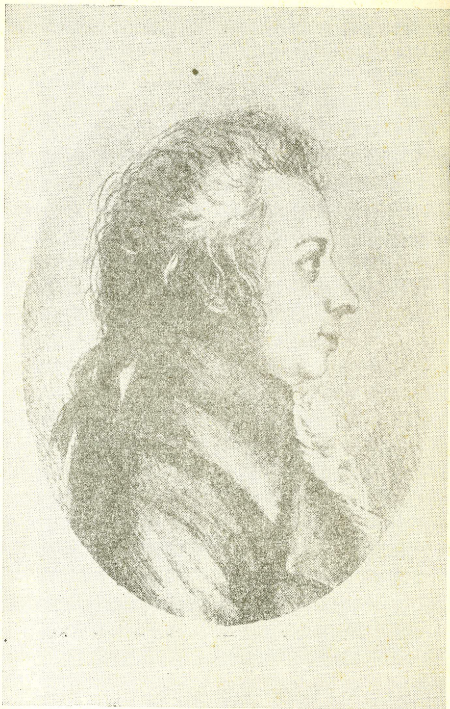
W. A. Mozart 1789. aastal