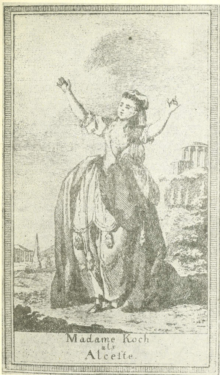
XVIII sajandi II poole näitlejannasid