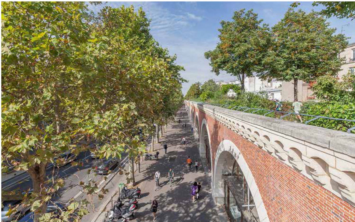
Visioonikonkursil osalenud arhitektide nägemuses võiks linnahallist saada näiteks mõnus väliaedadega kogunemispai kogukonnale...

Teised soovivad pakkusid välja kindla funktsiooni, mida rajatis peaks täitma hakkama.