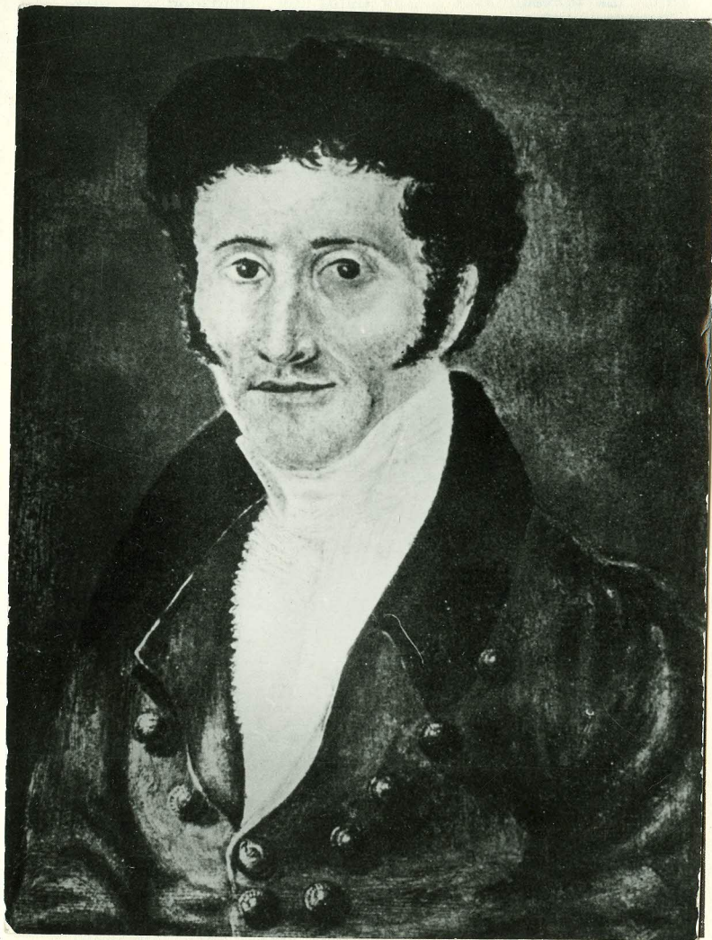
ERNST THEODOR AMADEUS HOFFMANN