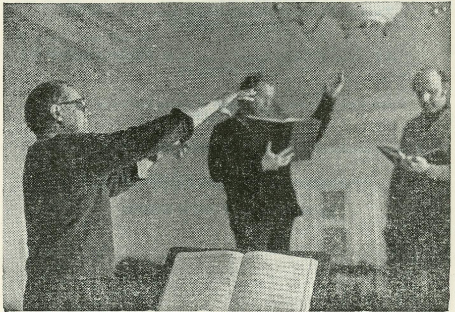
«Don Giovanni» proovidelt. Jaanuar—aprill 1975.