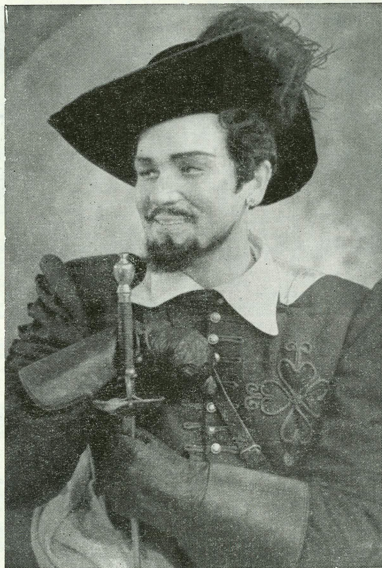
GEORG OTS DON JUANINA 1952. A.