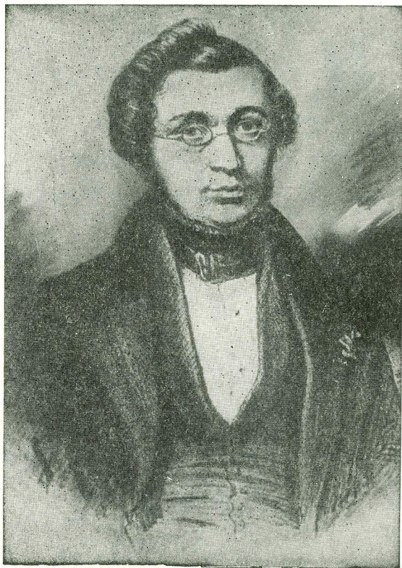
А. А Д А Н