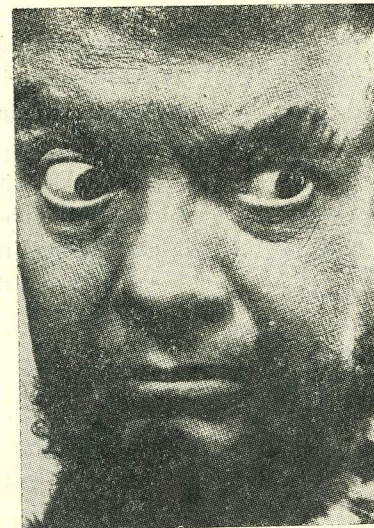
Tito Gobbi — Amonasro