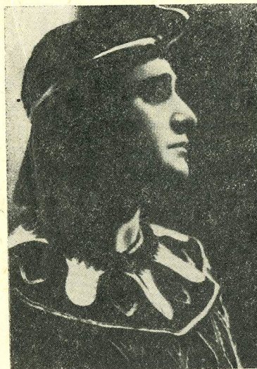
Beniamino Gigli — Radames