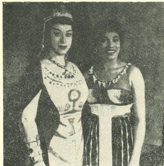
Regina Resnik (Amneris) ja Leontyne Price (Aida)