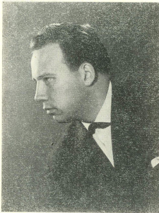
Neeme Järvi Неэме Ярви