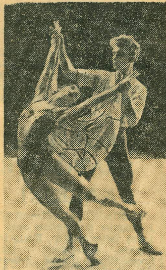
«Poiss ja liblikas»