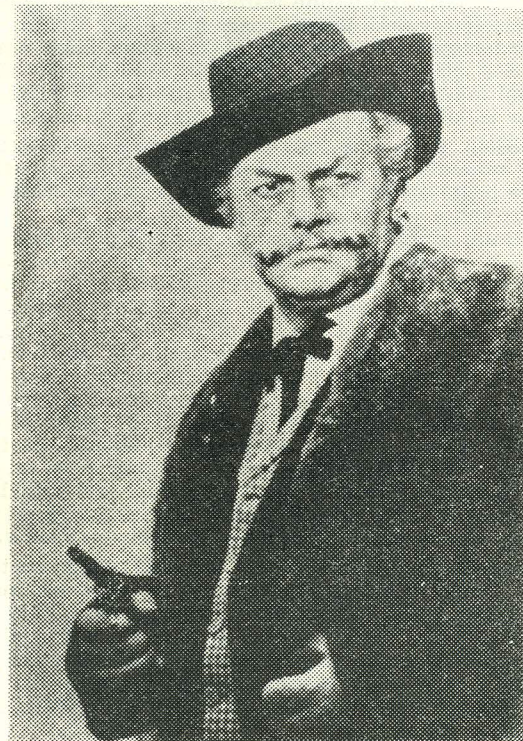
Kaasaja tuntuim Rance osa esitaja: Tito Gobbi

Tänapäeva tingimustes, mil kogu kaasaegse muusika helikeel on muutunud lakoonilisemaks ja kontsentreeritumaks, mil «kostüümides kontserdi» asemel nõutakse lavalt sisutihedat ning psühholoogiliselt läbitunnetatud draamat, mil lauljad peavad kõlavate häälte kõrval meisterlikult valitsema ka sõna — nende nõuete ja tõepriintsiipide valgusel on viimasel