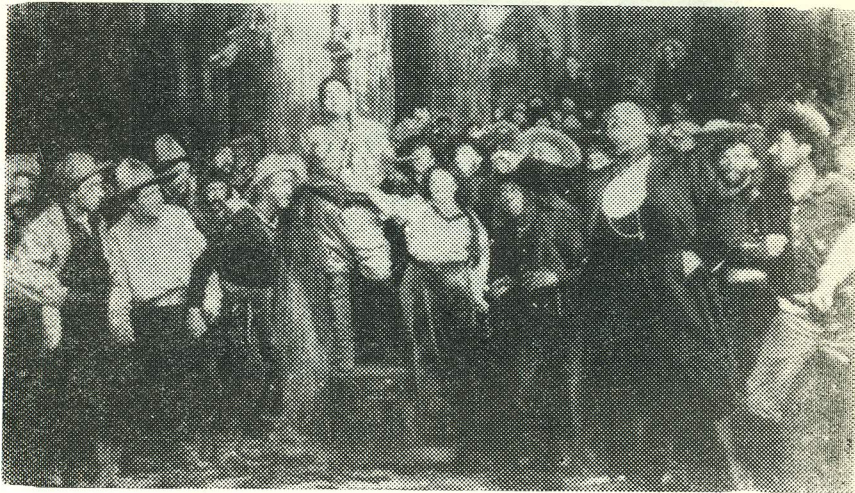
Stseen ooperi esiklavastusest «Metropolitan» teatris 1910. a.

10. detsembril 1910. a. avaneski eesriie «Metropolitan Operas» Puccini uuele ooperile «Tütarlaps kuldsest läänest». Ooperi menu ja kogu esietenduse meeoleolu oli erakordselt pidulik. Peaosilaulsid sellised kuulsused nagu Emmy Destinn (Minnie), Enrico Caruso (Dick Johnson) ja Pasquale Amato (Rance). Dirigendipuldis aga seisis Arturo Toscanini.