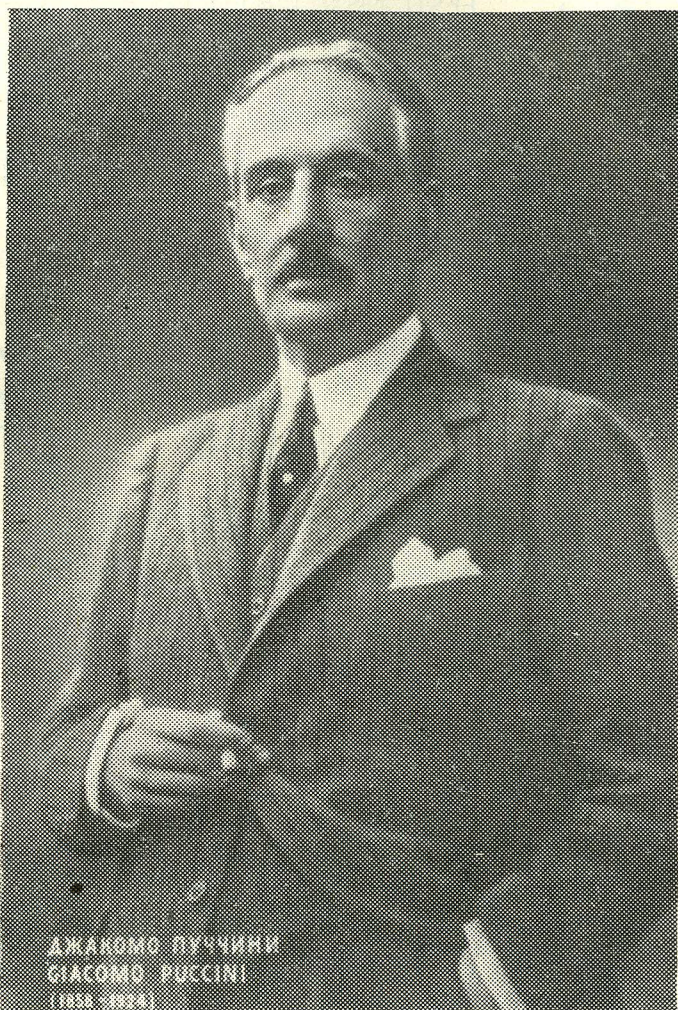
ДЖАКОМО ПУЧЧИНИ GIACOMO PUCCINI (1858-1924)