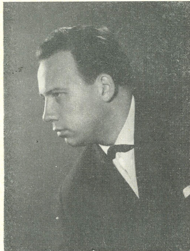
Neeme Järvi Неэме Ярви

Butterfly peab sellega nõustuma. Ahastades jätab ta lapsega jumalaga ning oma isa noaga võtab ta endalt elu.