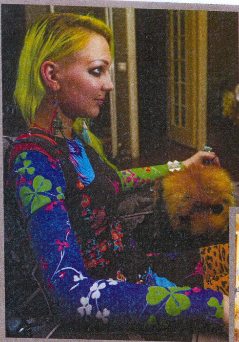
Kleit Versace for H&M. "Selles kleidis on rohkem värve kui 80ndates. Täiesti jabur!"