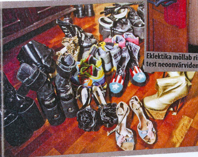
Platvormisaapad kuuluvad Grete igapäevaste jalanõude hulka. Vahel õnnestub tal siiski ka kingakesed jalga meelitada.