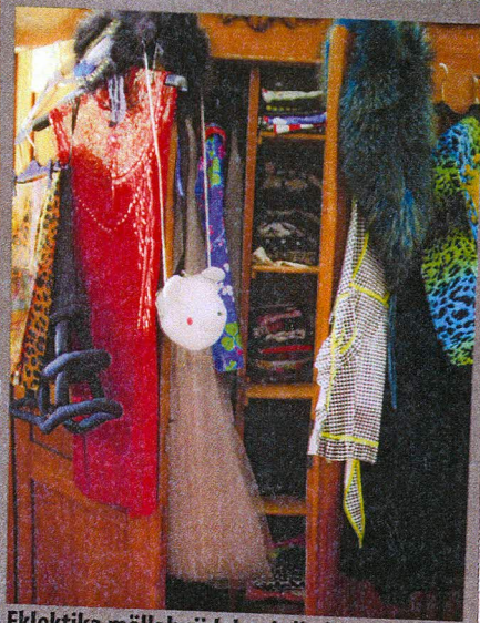
Eklektika möllab riidekapis litritest neonvärvideni ja tagasi.