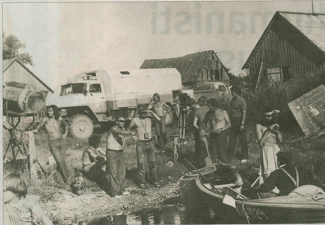
Filmi „Siin me oleme“ võtetel.

Ehk oleksid jutud Nõmmiku käsikirja hävimisest isegi tõeks osutunud, kui