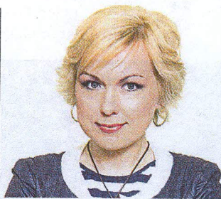
TEKST INGRID VEIDENBERG

Sel talvel polegi jõudnud, eelmisel käisin küll, aga läheme just sel nädalavahetusel pere ja sõpradega Käärikule suusalaagrisse. Mehed valmistuvad kolmandat aastat Tartu maratoni, sõidavad kõik rajad läbi. Mina teen poja-ga viiekilomeetrise ringi, ja kui jõuan, tahan ka 15 kilomeetrit läbi sõita. Tegelen talispordiga siis, kui mul ei ole kohe etendust tulemas, sest külma õhu sissehingamine on väga riskantne.