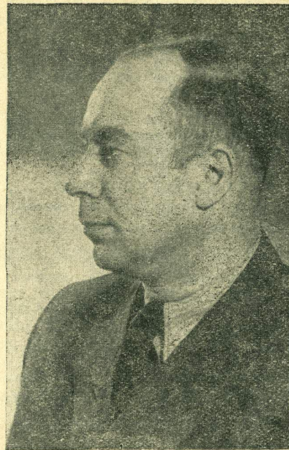
Helilooja EUGEN KAPP

Vangistatud tütarlaste ränga tööga kokkukuhjatud rikkused antakse rahvale.