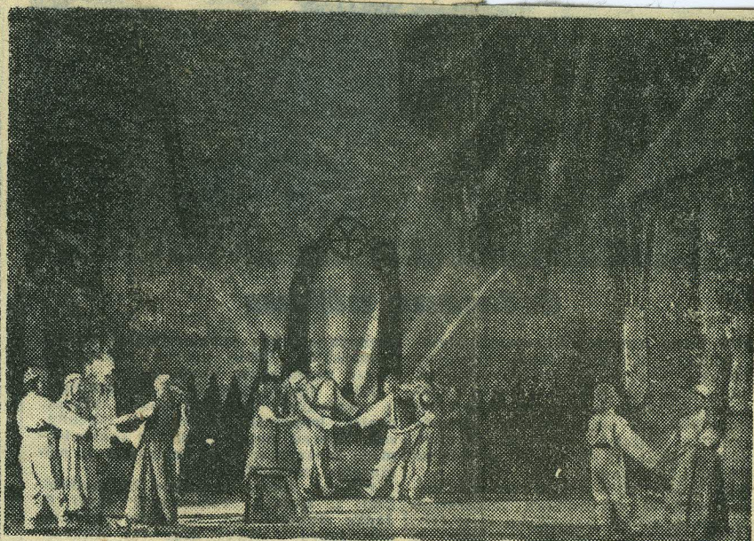
Stseene E. Kapi koreograafilisest poeamist „Kalevipoeg“. Vasakul: moment I pildist — Päike kosjas. Paremal „Karjaste tants“ II pildist. Ülal: Linda karjalapsega