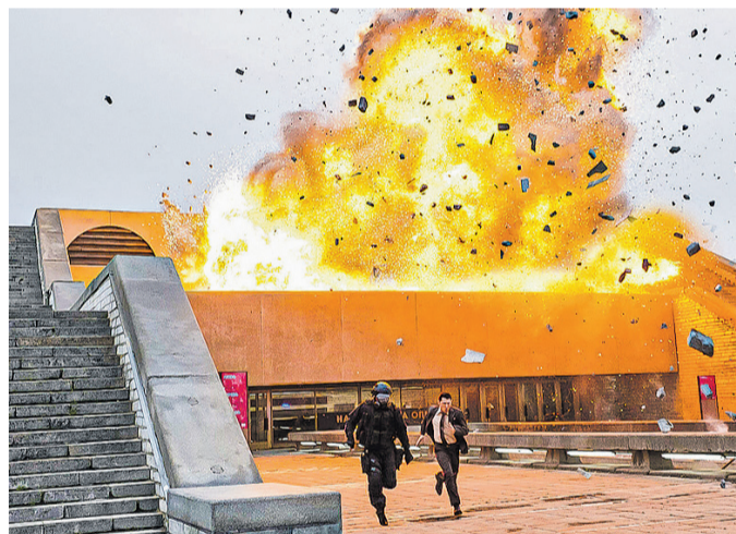
Parimate eriefektide eest sai kuldmehekesega muu hulgas Tallinnas filmitud „Tenet“.

Olukorra muutmise ja oma südametunnistuse puhastamise huvides võidakse aga lähijal poliitiliste väärtuste võidukaiku ees ohverdada esteetilisest kaalutlusest. Ka eheda, ent võrdlemisi pingeprii „Nomaadimaa“ puhul võib vaielda, kas tegemist on ikkagi tugevama linalooga, kui olid ainulaadse helimaastikuga „Sound of Metal“, mõjuv empaatiaharjutus „Isa“ või ehk teravmeelseim valikust, Emerald Fennelli vägistamise tagajärgedest rääkiv segažanriline „Paljutöötav noor naine“.