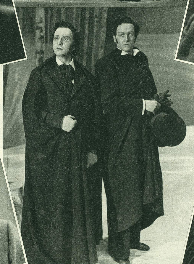
Ülal ja all stseene „Jevgeni Onegini“ lavastusest „Estonias“.